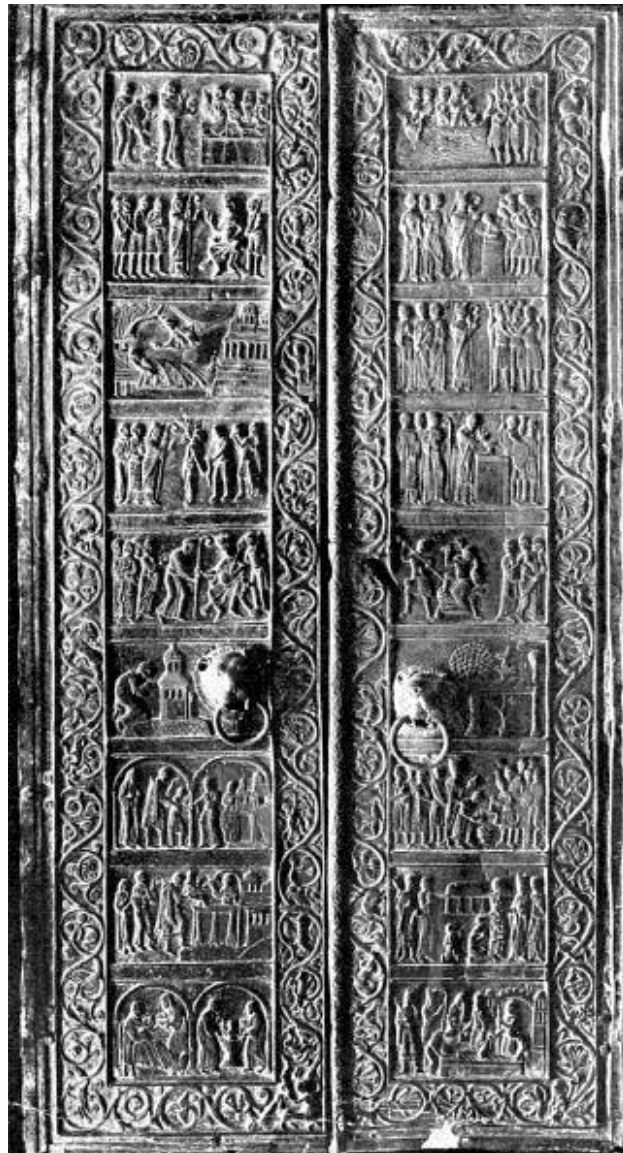
Čelní pohled dveří

(Ještě k nápisu bronzových dveří v Dómu NNV P.M. v Gnieznu – J Setunský, ČNS Tábor 2020)